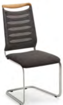
2219-LILLI PLUS: BHT 49/101/61 cm

COUCHTISCH MIT TISCHPLATTEN AUS GLAS, HOLZ ODER ULTRAHARTER KERAMIK