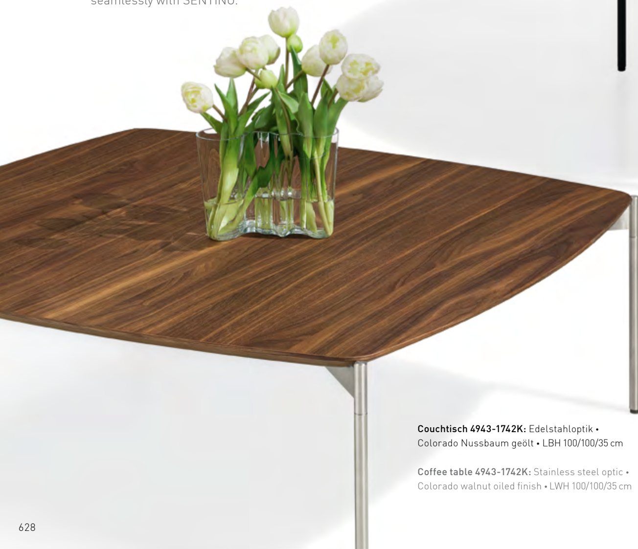
Couchtisch 4943-1742K: Edeldstahloptik • Colorado Nussbaum geölt • LBH 100/100/35 cm

RIO makes the difference and fits into your home perfectly. Available in a choice of three heights, RIO looks amazing in your living room, dining room, hallway or even conservatory. In combination with SENTINO, it produces a surprisingly refined look as well as sporting a robust finish. You can use the versatile RIO product line to create elegant highlights. Alternatively, finishes in Anziano or Santana oak allow it to blend in seamlessly with SENTINO.