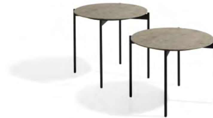
Beistelltisch 4946-1232L: Metall schwarz matt • Keramik beton • LBH 55/55/49 cm • Beistelltisch 4946-1232M: Metall schwarz matt • Keramik beton • LBH 55/55/42 cm