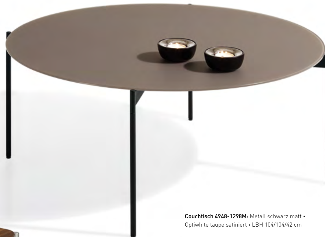
Couchtisch 4948-1298M: Metall schwarz matt • Optiwhite taupe satiniert • LBH 104/104/42 cm